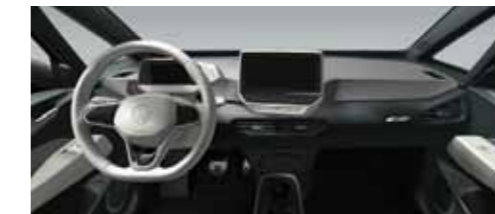
Εσωτερικό Γκρι Dusty Dark/Λευκό Electric