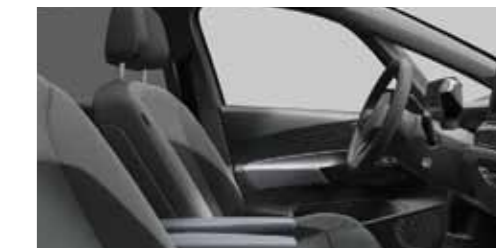
Interior Style «Plus» Γκρι Platinum/Γκρι Dusty Dark Υψηλή άνεση με ηλεκτρικά ρυθμιζόμενα καθίσματα