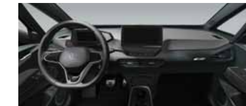
Εσωτερικό Γκρι Dusty Dark/Μαύρο Piano