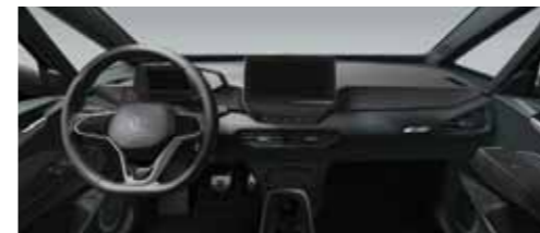
Εσωτερικό Γκρι Platinum/Μαύρο Piano