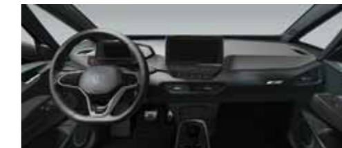
Εσωτερικό Γκρι Dusty Dark/Μαύρο Piano