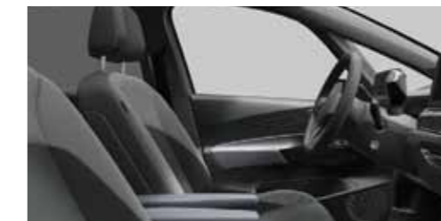
Interior Style Γκρι Platinum/Γκρι Dusty Dark Ξεχωρίζει χάρη στον μοναδικό σχεδιασμό