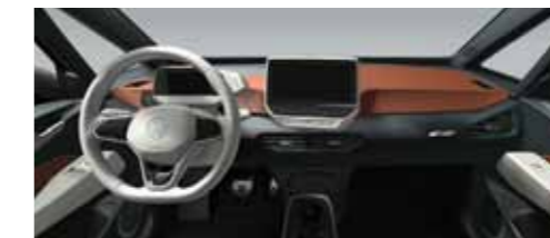
Εσωτερικό Πορτοκαλί Safrano/Λευκό Electric 4