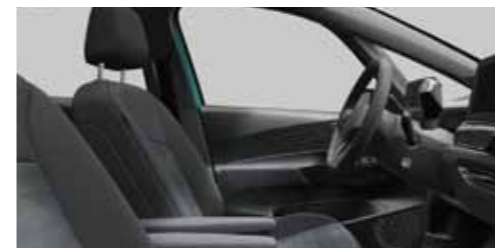
Βασικές επενδύσεις καθισμάτων Γκρι Platinum/Soul